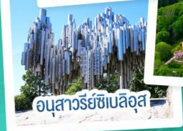
อนุสาวรีย์ซีเบลอุส

ฟินแลนด์ - เอสโตเนีย - ลัตเวีย - ลิทัวเนีย แวะเที่ยวเซี่ยงไฮ้