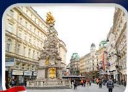
ช้อปปิ้งคาร์ทเนอร์สตรีก