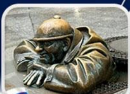
ประติมากรรม Cumil

มาเรียนพลาซซ์ • บ้านเกิดโมสาร์ท • พระราชวังฮอฟบวร์ก • ซาลส์บวร์ก • บ้านเกิดโมสาร์ท • เกรโกเดรสตรีก • ทะเลสาบคอนิกซ์ • หมู่บ้านอัลล์สตัดท์ • อนุสาวรีย์มาเรียเทเรซา