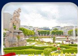
สวนมิรานาวิล ซาลซ์บวร์ก