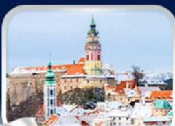
เมืองเซสกี คุลมลอฟ