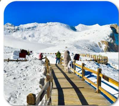
"ต่ากุกลาเซียร์"

เที่ยวชมความงาม 3 อุทยานชื่อดัง : สี้ดรุณี • ปีเฟิงโกว ต่ากุกลาเซียร์ ชมความน่ารักของหมีแพนด้า • จัตุรัสหยางเทียนวู ชอยกว้างชอยแคบ • ถนนคนเดินซุนซีลู่ • POP MART