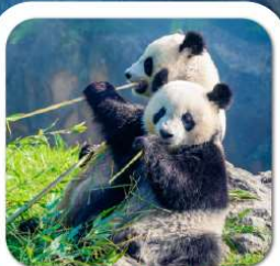
"ศูนย์หมีแพนด้า"