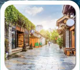
"ชอยกว้างชอยแคบ"