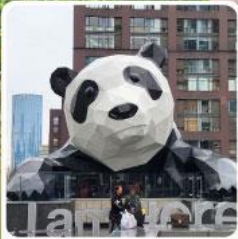
แพนด้าปิ่นตึก IFS