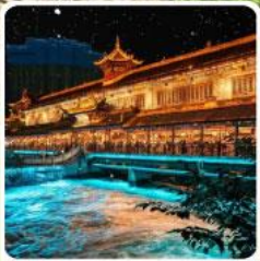
Blue Tears สะพานหนานเฉียว