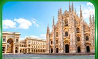
มหาวิหารดูโอโมแห่งมิลาน