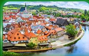
เมืองมรดกโลก เซลท์ครุมลอฟ