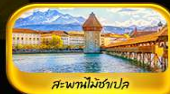
สะพานไมซ์าเปลา