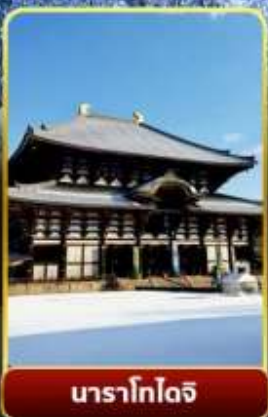
นาราโกไดจิ

พิเศษพักในเมืองคุสัทสึออนเซ็นพร้อมชมยูบาคาเกะ