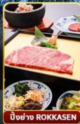
ปิ้งย่าง ROKKASEN

🌊 ออนเซ็น 3 คั้น 🧳 มน.กระเป๋า 1 ใบ 23 กก 🌞 9Days 6Night