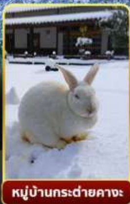
หมู่บ้านกระต่ายคางะ