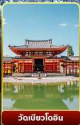
วัดเมียวโดอิน