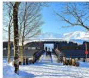
นั่งกระเช้าฮาคุนะ