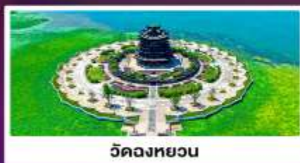
วิดงหววน