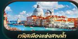
เวนิสเมืองแห่งสายน้ำ