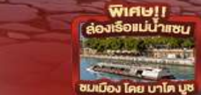
พิเศษ!! ล่องเรือแม่น้ำเซน ชมเมือง โดย บาโต บูช