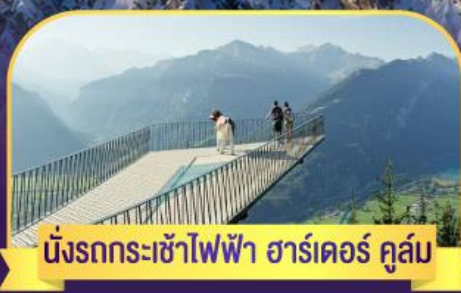
นั่งรถกระเช้าไฟฟ้า ฮาร์เตอร์ คูล์ม