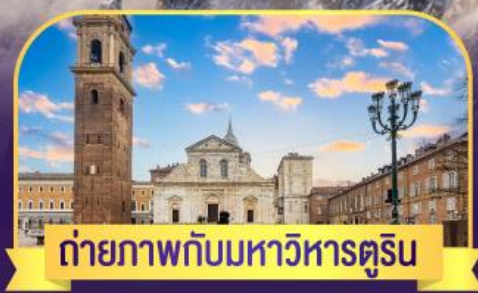
ถ่ายภาพกับมหาวิหารตูริน