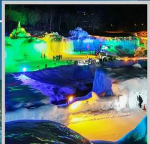
"SOUNKYO ICE FEST"