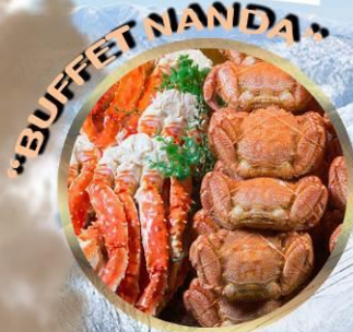
TOMAMU UNKAI TERRACE