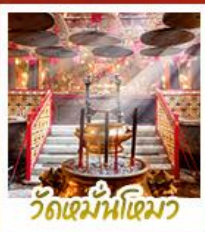
วัดมื่นไทมว