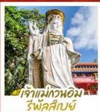
เจ้าแม่กวนอิม รพีลาสีย์