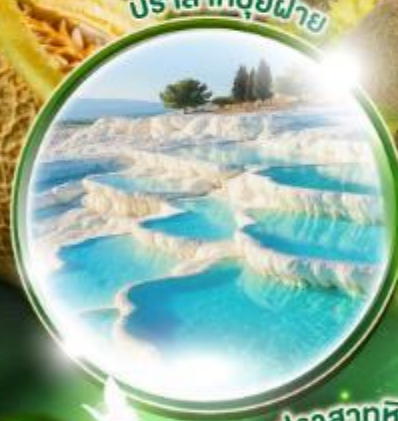
ปราสาทหินยิวซาร์