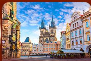
ชมย่านเมืองเก่า ปราก