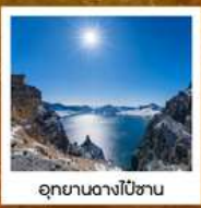
อุทยานดางไป่ชาน