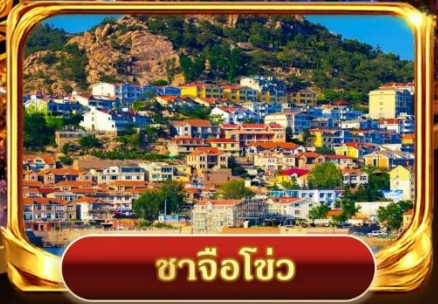
ซาจื่อโซ่ว