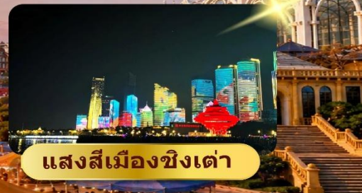
แสงสีเมืองชิงเต่า

เมนูพิเศษ ปิ้งย่างเซตโต๊ะ 6 วัน 4 คืน เดินทาง : 26-31 ก.ค. 69 ชาบูสายพาน