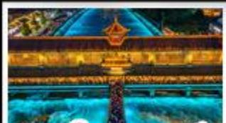
สะพานโบราณหนวยฮิว

อภยาบตำกู่ปิงชว่น - อุทยานสี่ดรุณี - หมี่แพนด้าเซลฟี ป่าฟิมิน่าตีกSKP - อุทยานปีแห่งไท่โถว - สะพานโบราณหนวยฮิว สตรีทอาร์ต Eastern Suburb Memory - เมืองโบราณลั่วใต้ เบมูพิศษ หม้อไฟหมาล่า