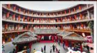
เมืองโบราณลั่วใต้