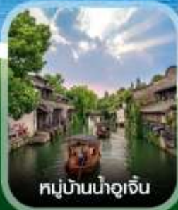
หมู่บ้านน้ำอู๋เจิน