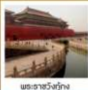
พระราชวังกรุงปักกิ่ง