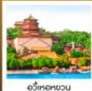
อวี่เหอหยวน

ลิ้มรสเมนูพิเศษ เปิดปักกิ่ง / สุกี่มองโกล มิซซอซิน TAO TAO JU