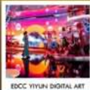
EDCC YIYUN DIGITAL ART