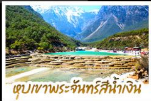
เขื่อนเขาพระจันทร์สีน้ำเงิน