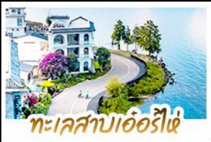
ทะเลสาบเอ๋อร์ไห่