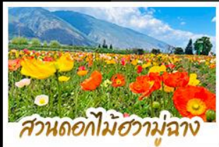
สวนดอกไม้ฮวามู่ฉาง