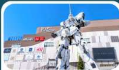
ห้างโตเวอร์ซิตี