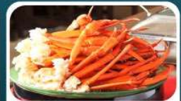
ชาบูบุฟเฟ่ต์