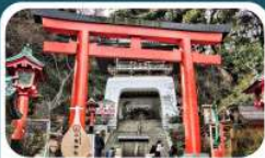
ศาลเจ้าอินะชิมะ