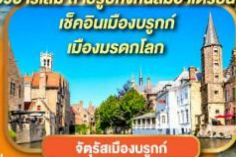
จตุรัสเมืองบรูคซ์