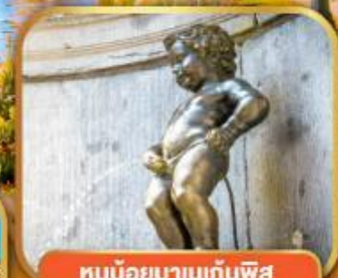
ทูน้อยมานกันพิส