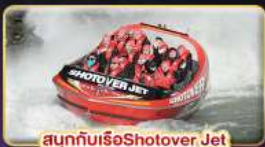
สนุกกับเรือ Shotover Jet