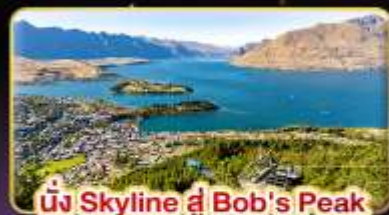
นั่ง Skyline ที่ Bob's Peak