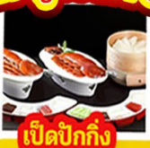
เปิดปิ้งกั๊ง