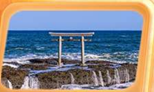
ศาลเจ้าโออาโรอิโซซาทิ

ชมภาพใกล้ชิด "ฟูจิซัง" ที่หมู่บ้านโอชิโนะ อักโก สวนโออิชิปาร์ค ที่เที่ยวน่า Unseen นั่งกระเช้าชมวิวภูเขาสิคะ ศาลเจ้าโออาโรอิโซซาทิ เสาโทริอิริมทะเล อลังการใบไม้เปลี่ยนสี น้ำตกเคงอน ศาลเจ้านิกโกโทโชกุ เสริมมงคล วัดพระใหญ่ซึคิ ไดบุทสึ ห้ามพลาดโคมแดงยักษ์ วัดอาซากุสะ อันอร่อยตลาดปลาโทโยสุ ทักทายแมว 3D ย่านชิจูกุ ช้อปปิ้งจตุใจย่านดังชิบูย่า