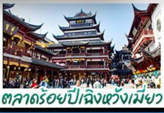
ตลาดร้อยปีฉิงหวงเหมียว