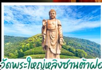
วัดพระใหญ่เฉิงชานต้าฝอ