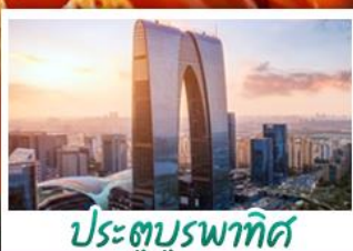
ประตูบูรพาทิศ