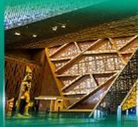
พิพิธภัณฑ์แกรนด์อียิปต์ (GEM)