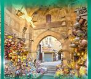
ตลาดผ่านเวลาอัลลี