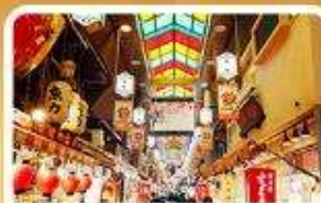
ตลาดปลานิชิกิ