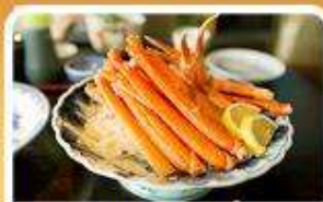
พิเศษ! ซาซู