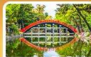
ศาลเจ้าสุมิโยชิ โทเบ