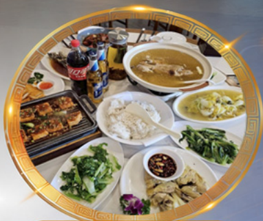
โต๊ะจีนลงซิ่ง เมนูต้นตำรับ รสจัดจ้านแท้ๆ