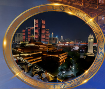
มือค้ำร้านอาหารวิวหลักล้าน ชมแสงสีเมืองลงซิ่ง