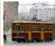
นั่งรถรางชมเมืองต้าเหลียน

ต้าเหลียน • ตานตง • เสินหยาง 6 DAYS 5 NIGHTS