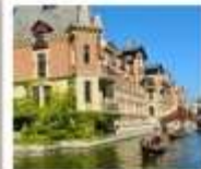
เวนิสแห่งต้าเหลียน