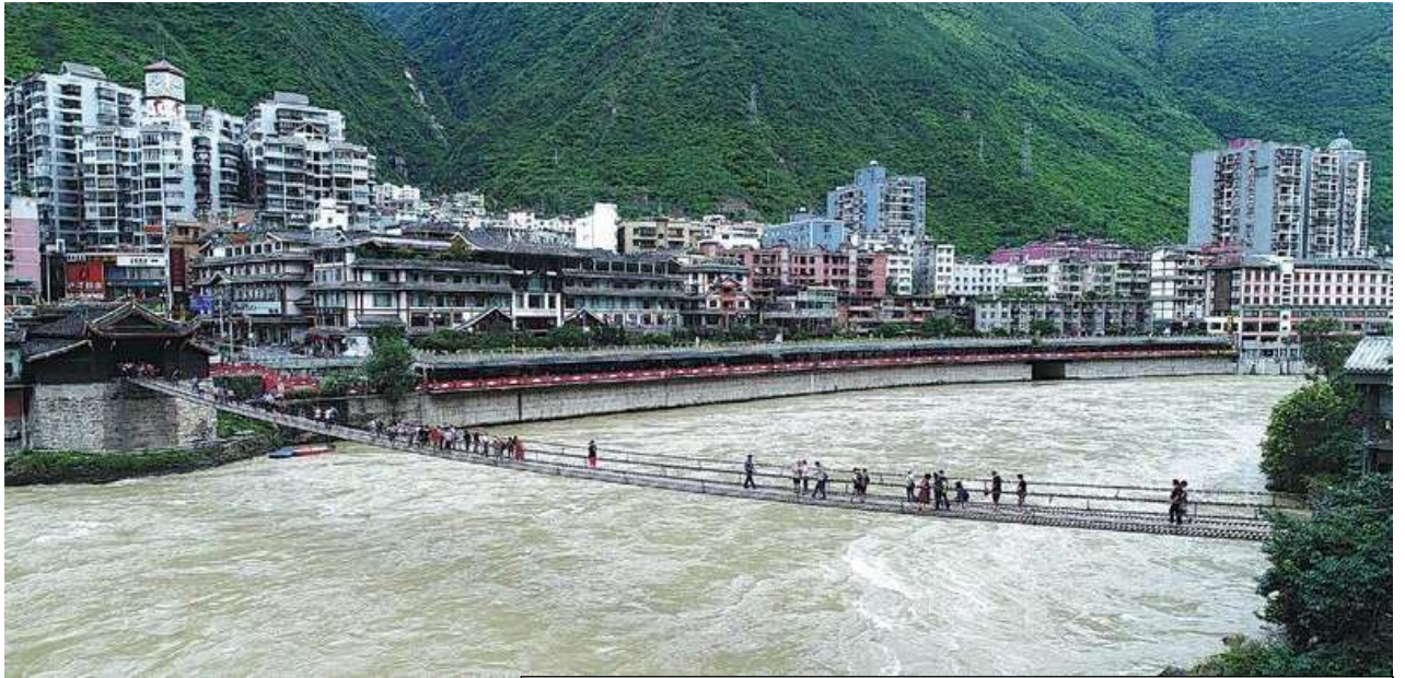
(WANG HUABIN / FOR CHINA DAILY) https://www.chinadailyhk.com/hk/article/223003

นำชมสะพานโซ่เหล็กตั้ง Luding Chain Bridge 泸定桥 สะพานโซ่เหล็กตั้งอยู่ริมแม่น้ำต้าตู Da Du River Bridge 大渡河 ในอำเภอหลู่ต้ง มณฑลเสฉวน เป็นสะพานเชือกเหล็กที่ปูด้วยไม้กระดาน มีความยาว 103 เมตร กว้าง 3 เมตร มีโซ่เหล็ก 13 เส้นซึ่งติดอยู่ปลายทั้งสอง ซึ่งใช้ห่วงเหล็ก 12,164 ลูกเชื่อมต่อกันทั้งสะพาน มีน้ำหนักมากกว่า 40 ตัน ตามตำนานเล่าว่า จักรพรรดิคังซีทรงรวมประเทศจีนเป็นหนึ่ง เพื่อเสริมสร้างการแลกเปลี่ยนทางวัฒนธรรมและเศรษฐกิจในเขตเสฉวน-ทิเบต พระราชทานพระบรมราชานุมัติให้สร้างสะพานนี้ขึ้นในปี ค.ศ. 1705 แล้วเสร็จในปี 1706