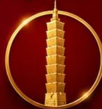
เสริมดวงเศรษฐี