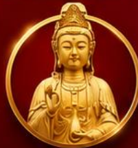
รับพลังบารมีเจ้าแม่มาจู่