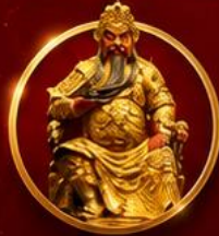
ขอพรเทพเจ้ากวนอู

เปิดดวงเศรษฐี เสริมดวงจួយี่ใต้หวัน ขอพรเทพกวนอู รับพลังบารมีเจ้าแม่มาจู่ 4 วัน 3 คืน