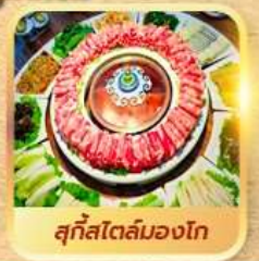
สุกีสโตลิมองโก