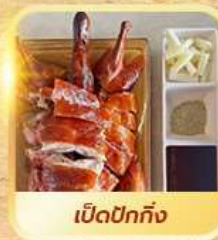
เปิดปอกทั้ง