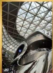
พิพิธภัณฑ์ศิลปะร่วมสมัยเซินเจิ้น

ชมสถาปัตยกรรมระดับโลก พิพิธภัณฑ์ศิลปะร่วมสมัยเซินเจิ้น (MOCAPE) และ Shenzhen Civic Center