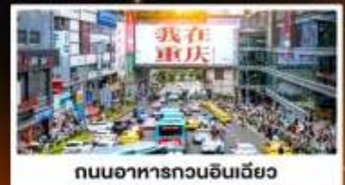
ถนนอาหารถวณอินเจียว