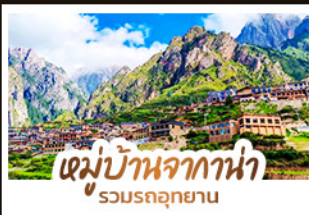
หมู่บ้านจากาน่า รวมรถอุทยาน