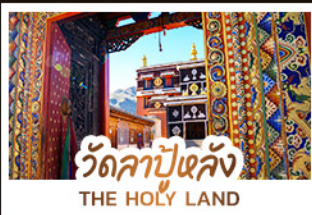
วัดลาปูหลง THE HOLY LAND

หนึ่งศรัทธา: สัมผัสความสงบและสถาปัตยกรรมทิเบตที่ วัดลาปูหลง หนึ่งผืนหญ้า: ส่องลอยไปในความเขียวจีของทุ่งหญ้าชางเคอ หนึ่งสายน้ำ: ค้นพบความงามเหนือกาลเวลาที่ จิวจ้ายโกว