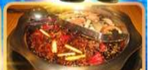
สุกี้ท้องถิ่น