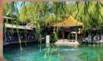
พิพิธภัณฑ์เบียร์ซิงเต่า