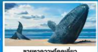
ซากหาวาฬโดคเคี้ยง