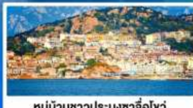
หมู่บ้านชาวประมงซาจื่อโหว่