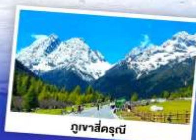
ภูเขาซีครุณี