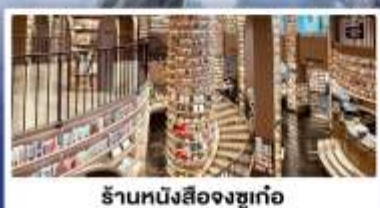
ร้านหนังสือจงซูเก้อ