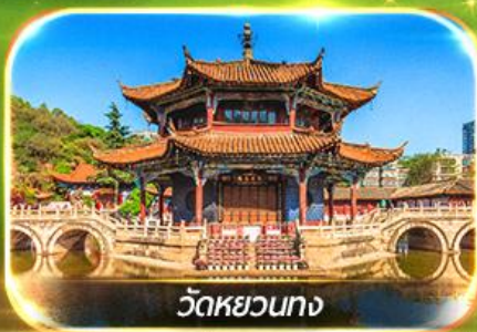
วัดหยวนทาง