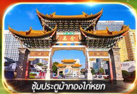
ซุ้มประตูม้าทองไก่หยก