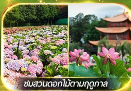
ชมสวนดอกไม้ตามฤดูกาล

นั่งกระเช้ากุเขาศิมะเจี้ยวจื่อ ชมน้ำตกสุดอลังการสวนน้ำตกคุนหมิง ช้อปปิ้งถนนคนเดินหนานผิงเจี๋ย, ชมดอกไม้ตามฤดูกาล