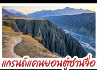
แกรนด์แคนยอนตุ่ซ่านจื่อ