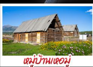
หมู่บ้านหอมู่