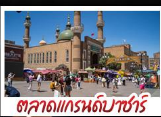
ตลาดแกรนด์บาซาร์