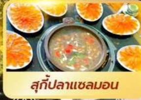
สุกี้ปลาแซลมอน