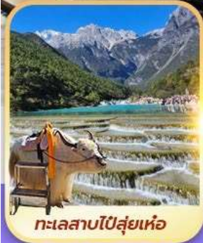
ทะเลสาบไป๋ซู่เหย่