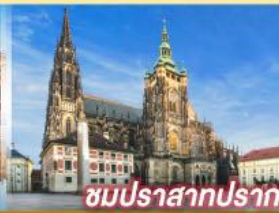
ชมปราสาทปราท