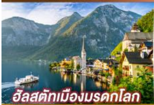
อิลสติกเมืองมรดกโลก