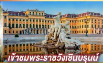
เข้าชมพระราชวังฮินบรุนน์