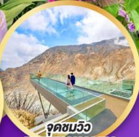
จุดชมวิวก EARTH VALLEY