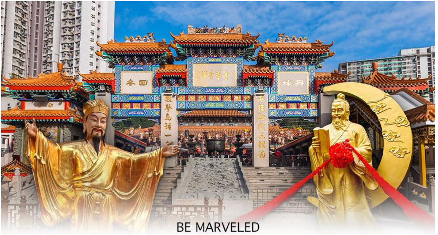
BE MARVELED วัดหวังต้าเซียน

ฮ่องกงบอกว่าถ้าเป็นผู้หญิงอย่างเราอยากได้แฟน ก็ต้องไปผูกค้ายี่รูปปั้นผู้ชายและพอไหว้เสร็จแล้วก็อย่าลืมหยอดทำบุญใส่ตู้ไปด้วย