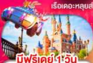
มีฟรีเดย์ 1 วัน