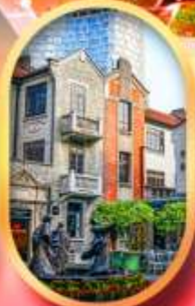
ย่านซินเกียนตี้