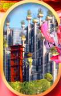
อาคารพินดิงไม้