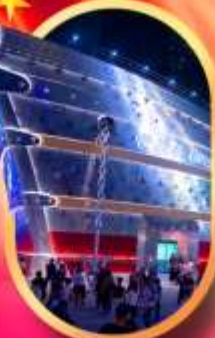
เรือเดอะหลุยส์