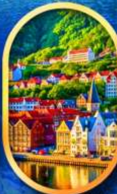
พิกเมืองเบอร์เก็น