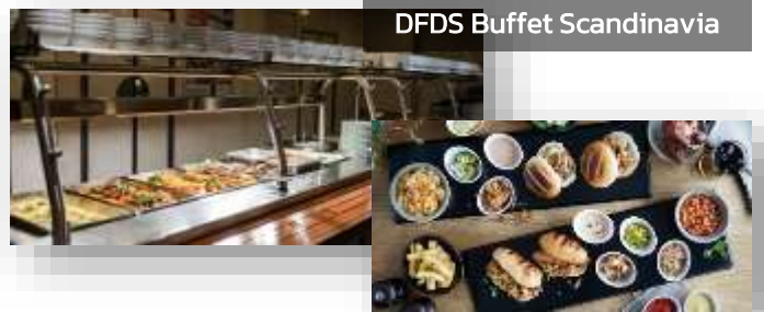
DFDS Buffet Scandinavia

ค่ำ บริการอาหารค่ำแบบบุฟเฟ่ต์ ณ ห้องอาหารของเรือ DFDS