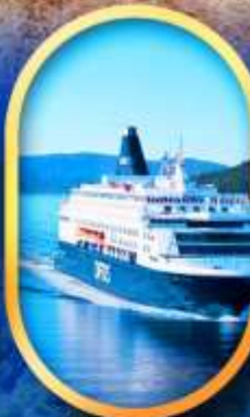
นั้งเรือ DFDS