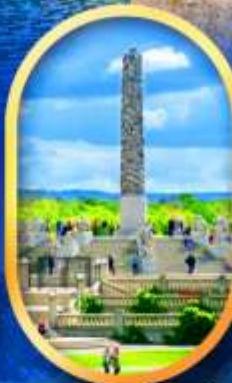
วิกเทอร์แลนด์