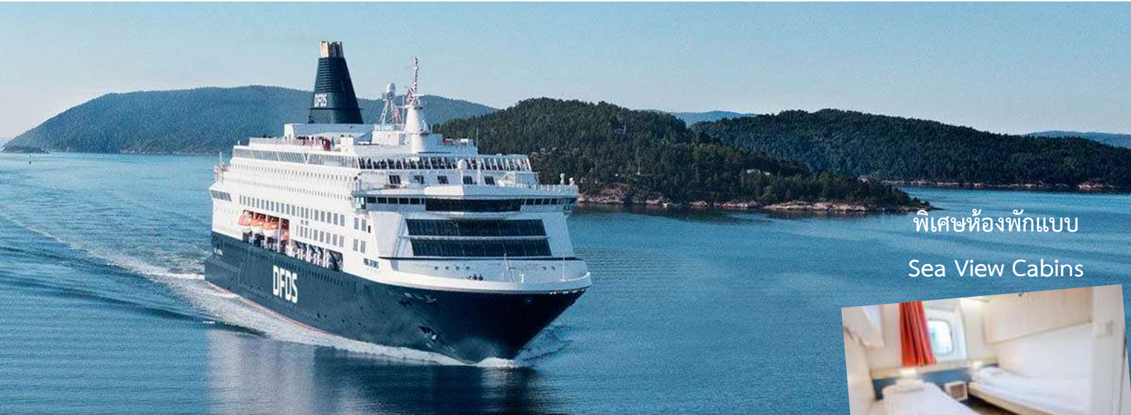
พิเศษห้องพักผ่อน Sea View Cabins