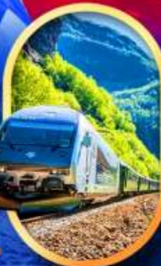
รถไฟฟลิมสขาน่า