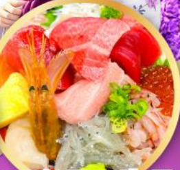
ตลาดปลาซิมิสุ คาชิโนะอิชิ